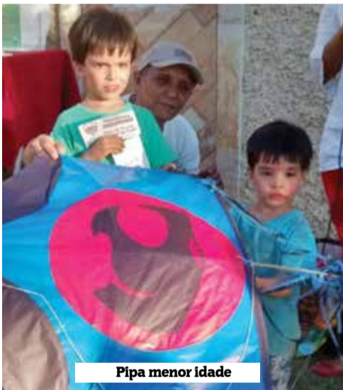
Pipa menor idade