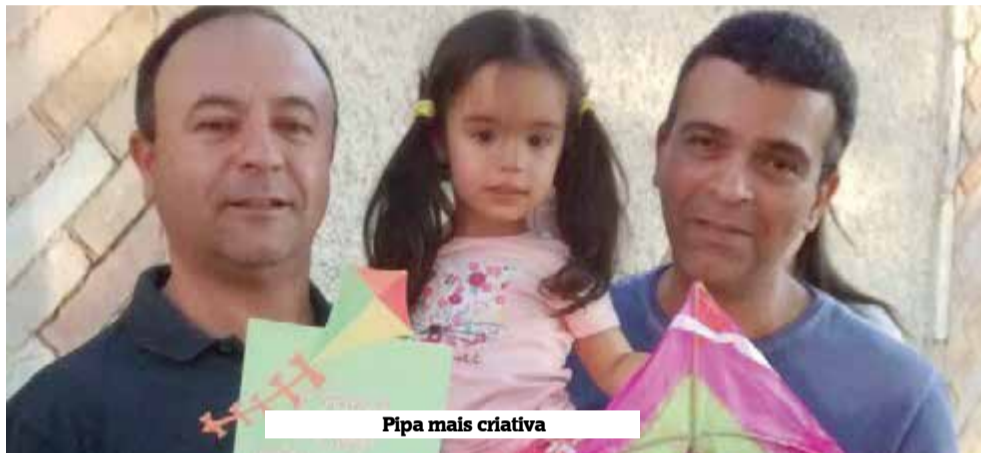
Pipa mais criativa