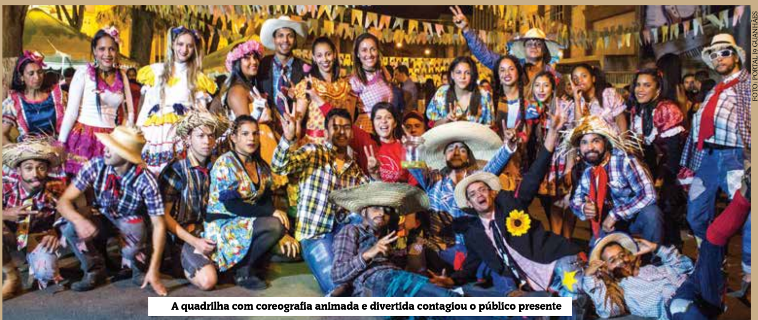
A quadrilha com coreografia animada e divertida contagiou o público presente

Vale lembrar que a Campanha Coração de Lacre é realizada pela Folha FM em parceria com