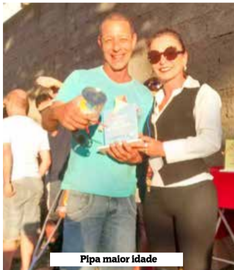
Pipa maior idade