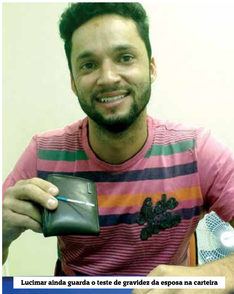
Lucimar ainda guarda o teste de gravidez da esposa na carteira