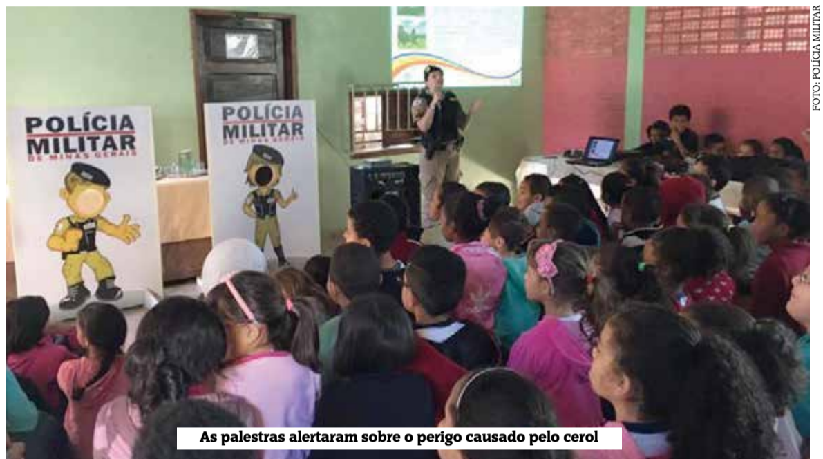
As palestras alertaram sobre o perigo causado pelo cerol

a prática de soltar pipa seja realizada em locais onde não haja rede elétrica, nem