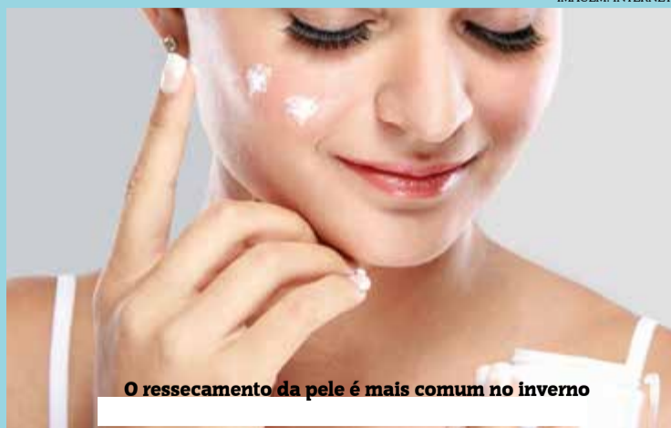
O ressecamento da pele é mais comum no inverno

O inverno segue até o dia 22 de setembro e a mudança drástica no clima pode trazer consequências negativas ao organismo humano, o que exige atenção e mudanças de alguns hábitos.