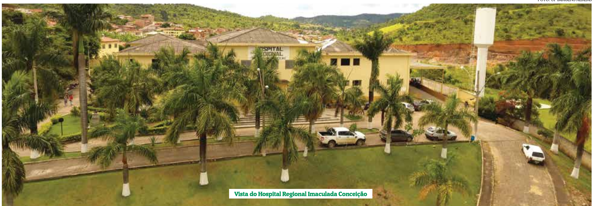
Vista do Hospital Regional Imaculada Conceição