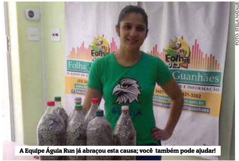
A Equipe Águia Run já abraçou esta causa; você também pode ajudar!